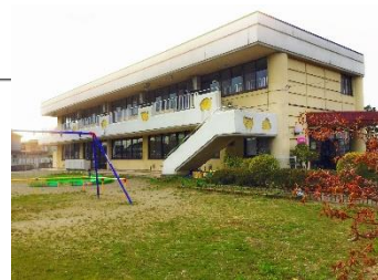
見附みどりこども園