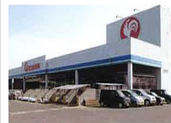
コメリホームセンター見附店